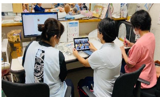
さくらのスタッフへ タブレットを使用しての申し送り

病院退院後、青洲会グループの施設への転入所のケースに関して、他施設より更に十分な連携を取っています。例えば、元気館サービスを利用の際は、スタッフが来院し、患者様の様子を実際見てもらい、密に情報伝達を行います。老健さくらへの転所のケースには、言語聴覚士の派遣時に動画でより詳しく患者様のリハビリの状況を伝え、連携を取っています。