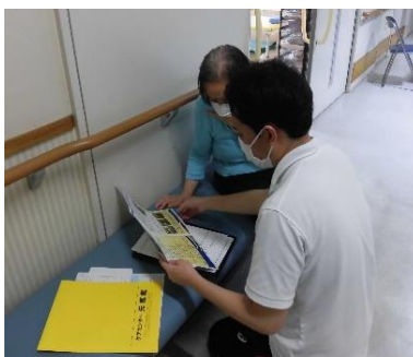
元気館スタッフによる施設の説明 患者様に直接お会いしての申し送り