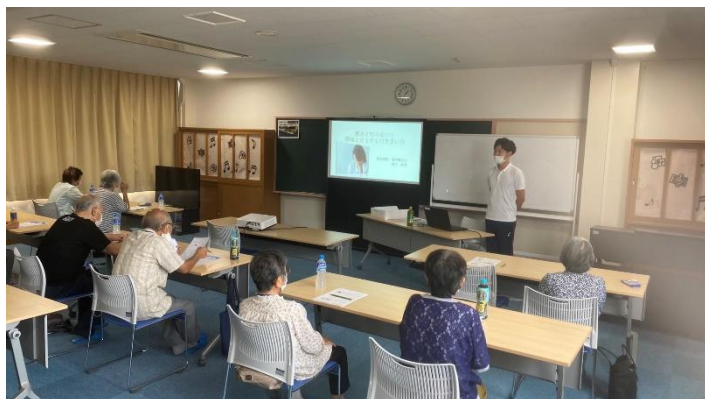
〈参加者様の聴講の様子〉