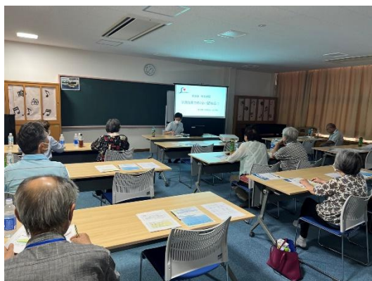
〈参加者様の聴講の様子〉